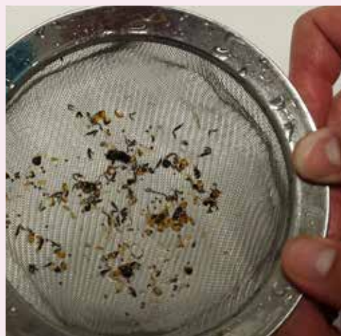
Acariens et autres débris récupérés dans le tamis après lavage des abeilles.