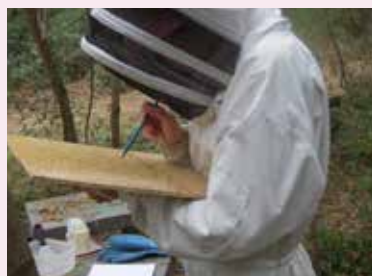
Comptage de varroas.