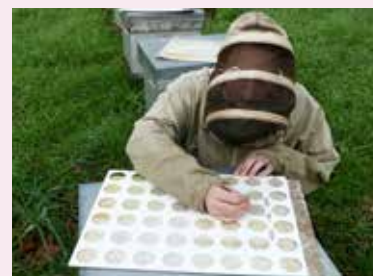
Comptage de varroas.