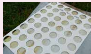
Plaque VarEval pour le comptage de varroas.