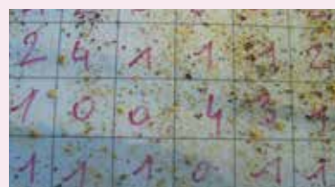
Lange quadrillé pour le comptage de varroas.