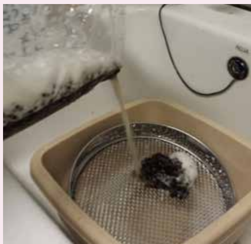
Lavage des abeilles à l'eau savonneuse.