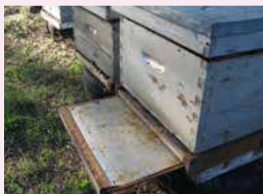
Lange placé sous la ruche pour le comptage de varroas.

Installer un plateau entièrement grillagé sous lequel est placé un lange graissé ou encollé (feuille de papier épais, plaque de métal ou de plastique mobile) est indispensable pour évaluer la population de Varroa d'une colonie.